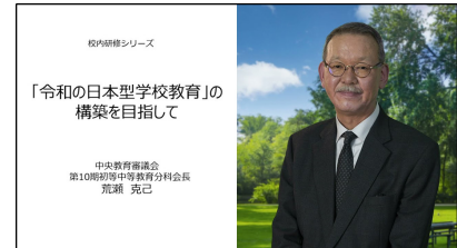
校内研修シリーズ講義動画画面例