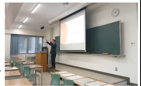
(高宮先生の御講演の様子)

この日も、前半は通常通り参加者による内容項目「真理の探究」に関する協議をじっくり時間をかけて行った上で講演をしていただく形を取った。後半の講演では、この内容項目に関する教材「天から送られた手紙」を扱ってお話いただけたため、参加者にとっては、自分が授業実践する際の様子をイメージすることができ、どのように展開していけばよいかを考えながら聴くことができたので、より深い理解につながっているようであった。