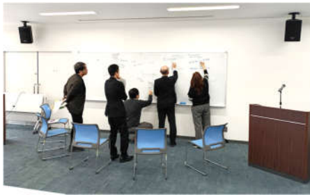
(個人の考えを出し合う様子)