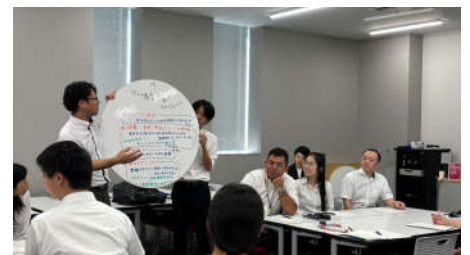
グループ発表の様子