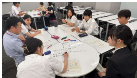
グループ協議の様子