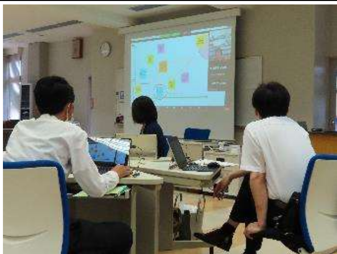
第3回 本図 愛実 教授の講義 「学校ビジョンの構築」