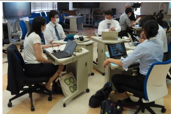
来所の受講者の意見交換の様子