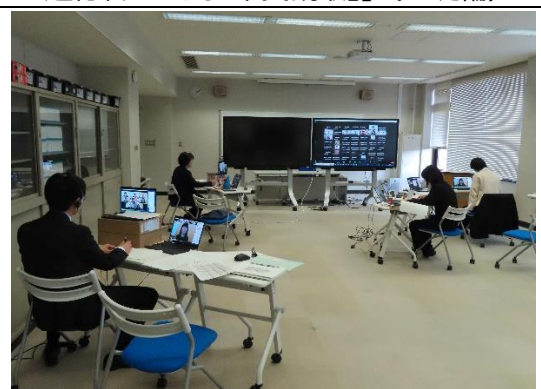
オンライン運営の様子