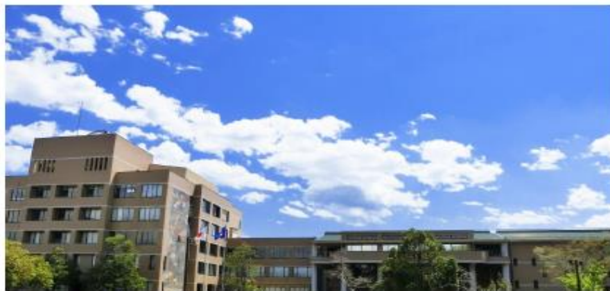
NITS・茨城県教育研修センターコラボ研修