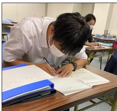
発表へのコメント記入