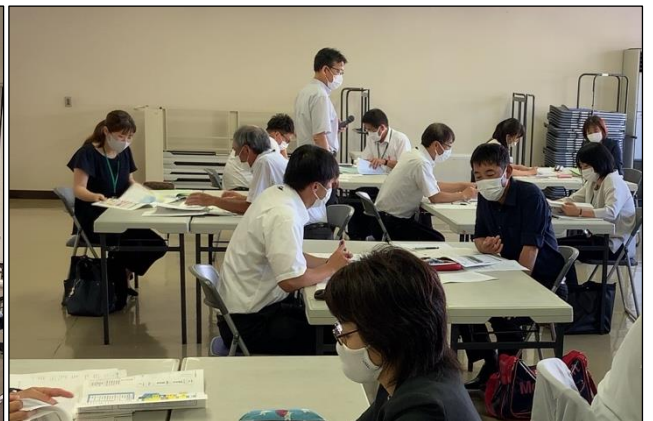
ペアやグループでの協議