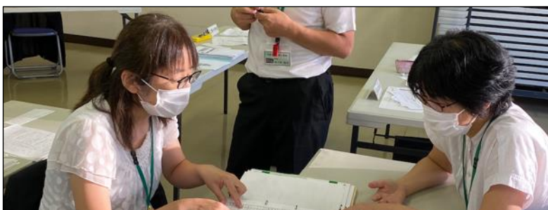
互いの実践計画についての熱い議論