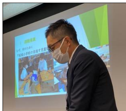
中間評価の際の発表