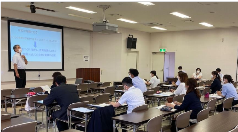
カリキュラム・マネジメントの講義・演習