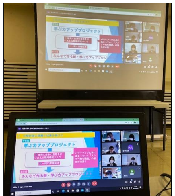
最終回の発表はリモートで実施（竹原市）