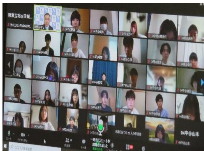
【ブレイクアウトルームによるディスカッションの様子】

小学校：4グループ、中学校：4グループ、高等学校：1グループ 特別支援学校：1グループ、養護教諭：1グループ、幼稚園：1グループ