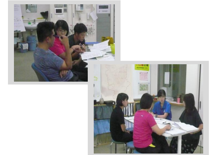
写真 1 <教科チーム研修>