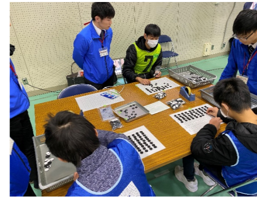
写真 1 作業体験の様子