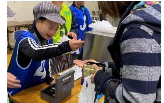
写真 2 販売体験の様子