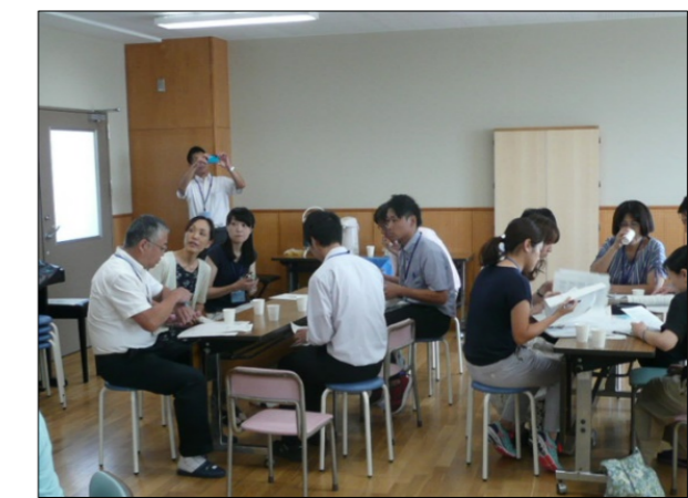
(写真1) 小中合同研修会