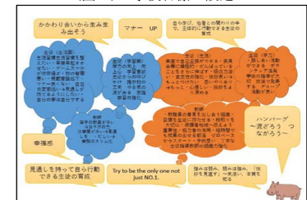
(図3) 学校目標の設定