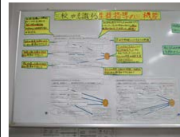
【写真1】生徒指導の三機能の掲示（職員室）