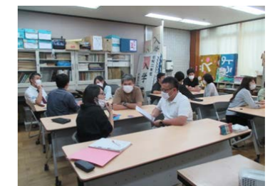
【写真3】若手・中堅研修風景

★新採1年目編 「思ったより取りに来い！」・・・考えたらわかるでしょ！ 「先生はうそつきです！」・・・はじめが肝腎、落ち着いて！ 「どうしたいの？」・・・どうしたいかんで考えたことない。 「知られてもええから，子どもと遊び！」・・・修学旅行の一環。 「先生はようと思った！ここでは怒らなかん！」・・・ごめん！子どもたち！ 「後ろから見ても」・・・こりゃわからんわ。 「時間は作るもんで！」・・・忙しいのはみんなや！ 「大人やし，お金で解決しよ！」・・・手取り早い！ 「道徳は前です！」「学級経営からやいなおそか」・・・学級経営って大事やなあ。 「ええ資料も履かんや」・・・やっぱり学級経営。 「どんな手を使ってでもゴール行くな」・・・「泣きながらでもちゃんとコース守ってゴール行くな」。 「誰かたか？」・・・ええ加減な情報-手帳実践。 「何のために掲示してんねん」・・・違うの？だって参照あるもん。 「教えてください！」・・・わかったら早いな。わからんことばねからへんでいい。 「頼んないけど，一生懸命」・・・たまらうらしい！ 「泣いてもええやで」・・・泣くようになったらこの時からやなあ。