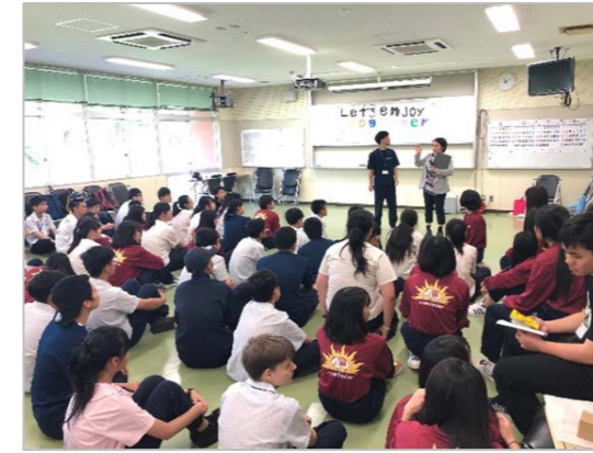
写真 1 台湾高校生との学校交流