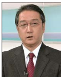
二宮 徹 NHK青森放送局 副局長 (前解説委員)