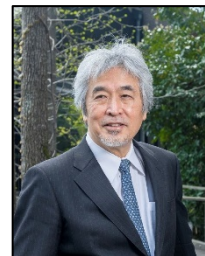
山極 壽一 総合地球環境学 研究所 所長