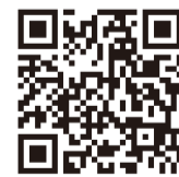
第2回NITS大賞 表彰式ダイジェスト映像